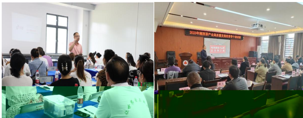
图 企业协助学校为湘西茶企开展电商直播培训

更 对 电 的 。 过 的 ， 茶 得 更 地 电 播的操 、 策 等方 的 ， 电 的 奠定 础。