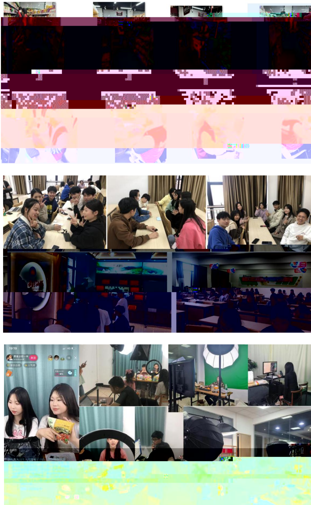
图 组织学生开展实习实训